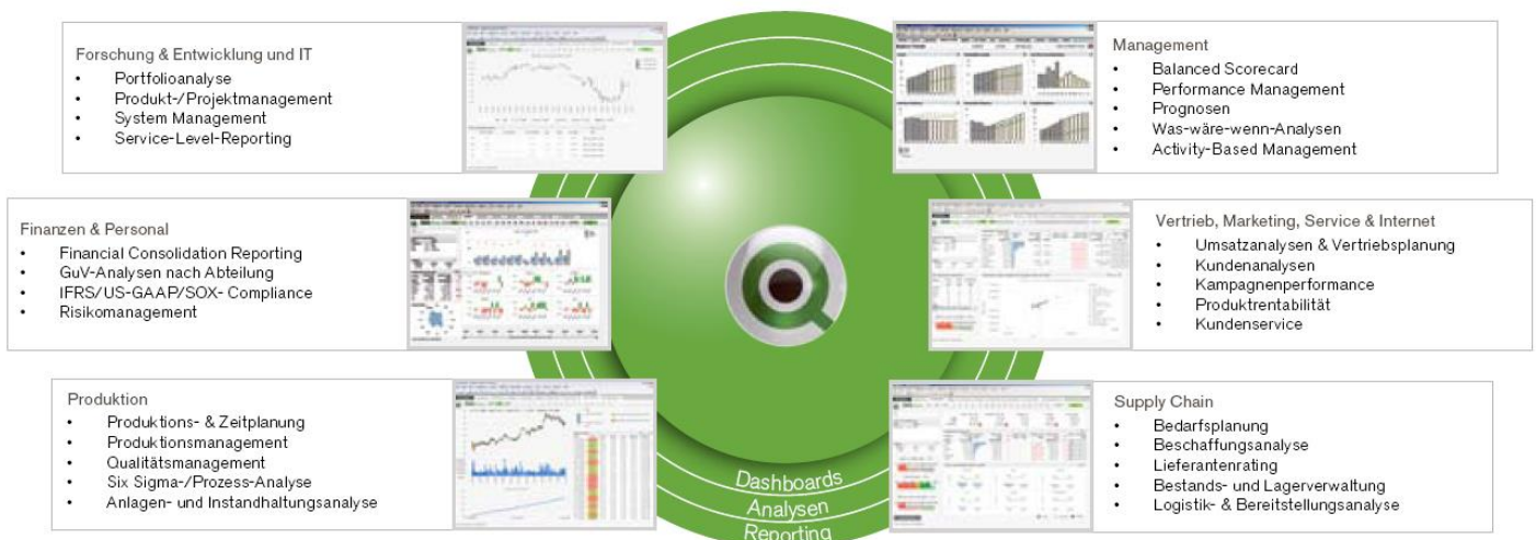
Typische Einsatzbereiche von QlikView

Die QlikView-Plattform gewährleistet, dass das Sicherheitsmodell innerhalb der Organisation eingehalten wird: Sowohl hinsichtlich des Zugriffs auf Analyseapplikationen als auch einzelner Kennzahlen und Daten innerhalb einer Applikation. Sicherheitsfunktionen lassen sich auf Basis standardisierter Active Directory-Sicherheitsmodelle oder der unternehmensweiten Sicherheitsplattform